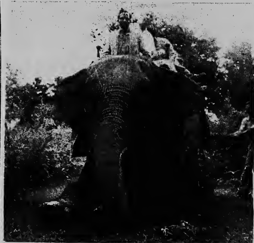
Den e terrenonan mas trabahoso ta necesario pa haci uso di elefante ora cu e ofisialnan di Unesco a bal Himalaya. Aki nan ta riba un elefante na momento cu nan tabata sallendo for di Koidwara pa inspecta un plantacion di fruta den e cerroan di Kumooan.